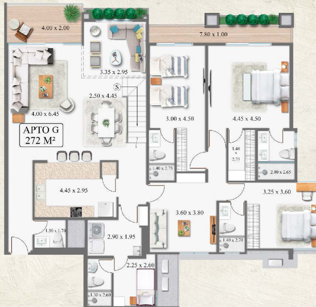
Nivel 300 - 272m 2 - Apto G Level 300 - 2927,78 - Apt G